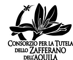
Versione Bianco e Nero

[stampa] 30mm @ 300dpi [web] 100px @ 72dpi